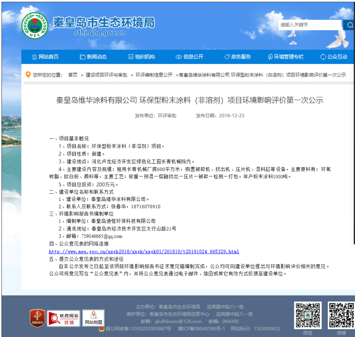
图2.2-1 首次网络公开情况图