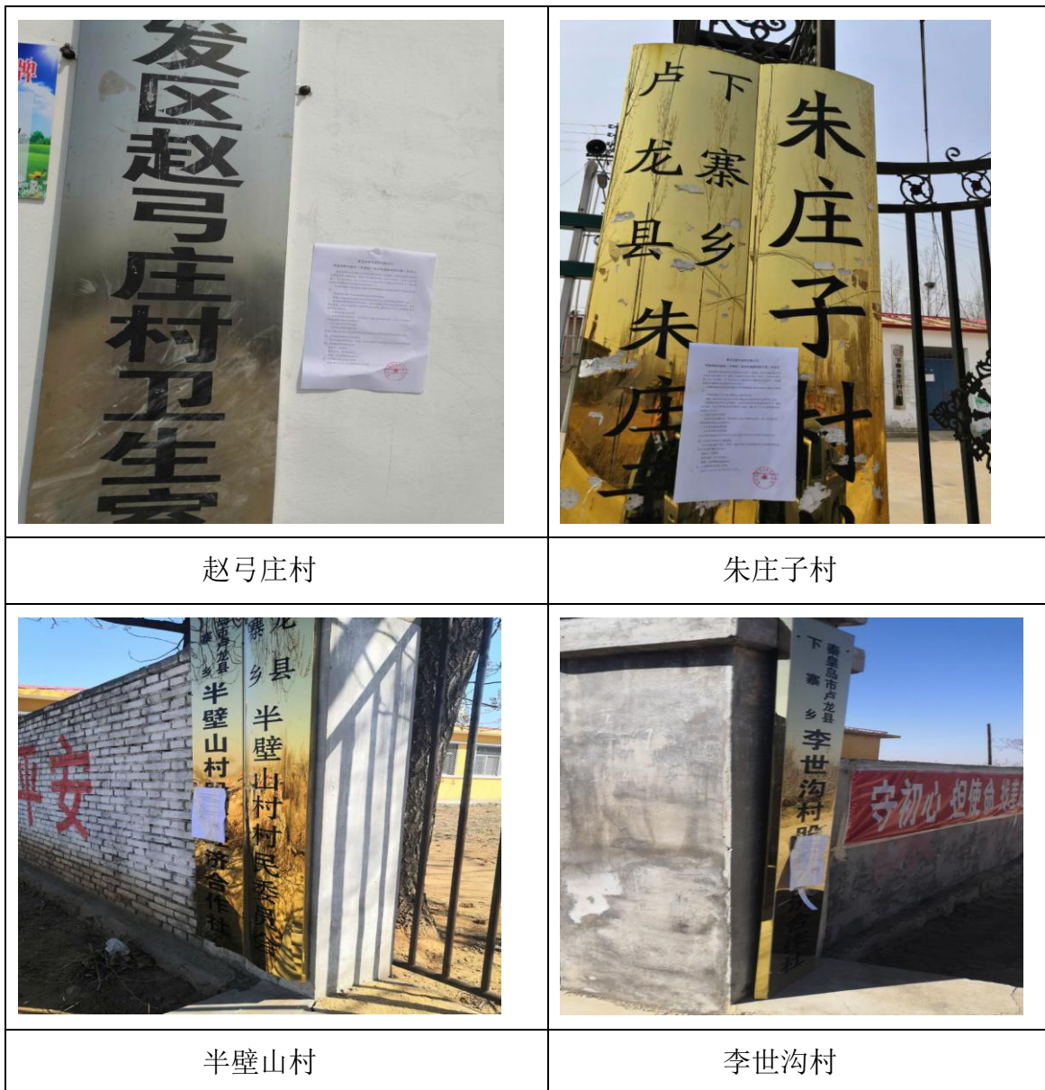
图3.2-2现场公开情况图