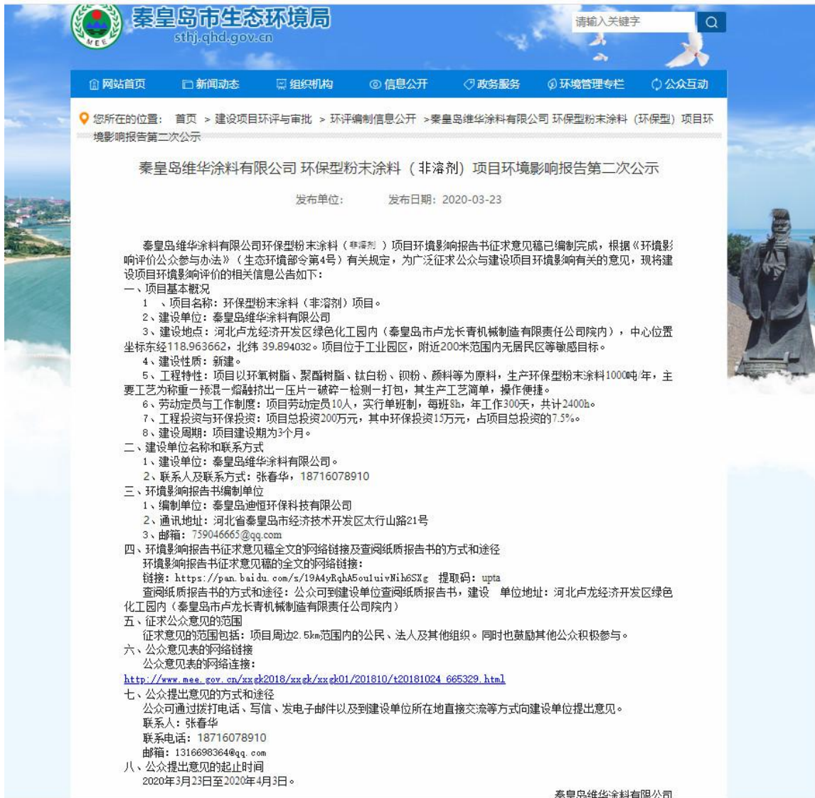
图 3.2-1 网络第二次公示截图