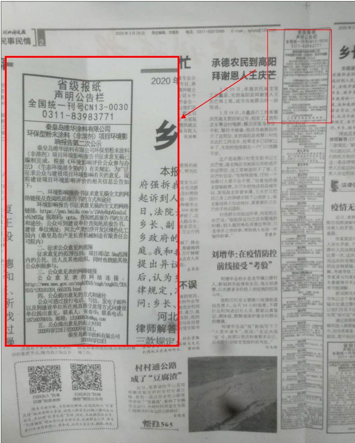
图3.2-2 报纸公开情况图